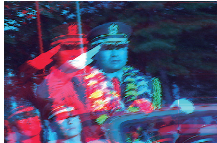
윤주경, 경례, 2010, 싱글채널 비디오, 비디오 스틸 © 윤주경, 아트스페이스 플