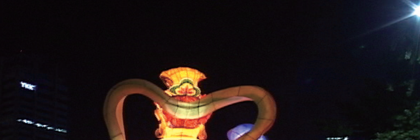
윤주경, 붉은 부처, 2010, 싱글채널 비디오, 비디오 스틸 © 윤주경, 아트스페이스 플

없는 (도래할) 무엇을 기다림을 위한 행렬이다. 사람들의 웅성거림과 키치적인 붓다조형물이 을지로를 지나는 장면은 마치 절대 오지 않는 절대자 "고도(Godot)"때문에 우왕좌왕하는 두 어릿광대가 연상된다. 내가 너의 웃음을 지켜준다는 광고 카피 같은 이번 전시의 주제는 도래할 유토피아에 대한 두 가지 행동양식을 행렬이란 형태로 보여준다. 그리고 한 가운데, 인적 없는 산의 오솔길을 걸어가는 화면이 있다. 2009년 사북 탄광촌에서 한 달간 오르내린 탄석 찌꺼기가 30년 넘게 쌓여 만들어진 자연화 된 인공산에서 찍은 영상작업 "A Black Mountain"(2009-2010) 이다. 윤주경에게 대지는 활벗은 호모사케르의 버려진 땅이 아니다. 그가 2008년 이후 기록하기 시작한 서울은 정치적 삶, 한나 아렌트가 얘기한 행위(action, praxis)와 말(speech, lexis)이 통제되는, 혹은 봉쇄된 장소가 되었다. 그리고 대로와 광장은 권력자를 기리며 초점 없는 예찬을 하고 저항의 행렬도 목표를 잃은 듯 공허하게 이동한다. 윤주경의 작업은 2008년 이후, 삶의 현장으로 다가간다. 다큐멘터리에 가깝게 어떤 현상을 쫓아가지만 과거 강렬한 이미지로 호소하던 것과 달라진 것은 없다. 과거엔 사건의 흔적에서 본인이 유일한 참여자였다면, 지금은 현실의 참여자로서 카메라 뒤에서 실재의 환영, 혹은 실재의 외상을 증언하고 있다.