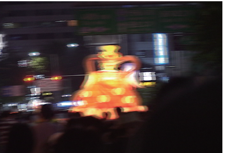
Joo Kyung Yoon, A Red Buddha, 2010, single channel video, video still